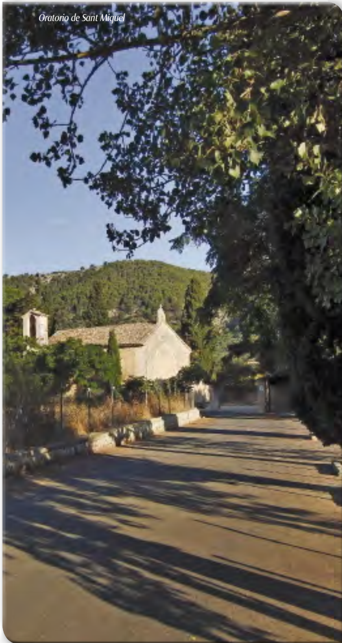
Oratorio de Sant Miquel